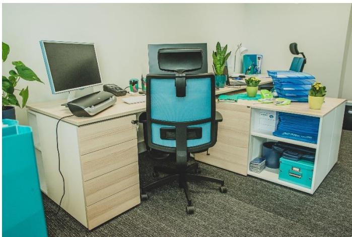
Joonis 1. Sisseostetava koolitaja töölaud kabinetis

Kabinetis on töötajate ning koolitajate kasutuses Canoni printer, mille abil on võimalik skaneerida, paljundada ning printida (A3, A4, A5). Ühtlasi on võimalik kasutada lamineerimismasinat, mille abil koostada nt õppemängude jaoks vajaminevaid kaarte (A3, A4, A5, A6). Kabinetis on kolm komplekteeritud töökohta, millest üks on mõeldud kasutamiseks koolituse läbiviivatele sisseostetavatele koolitajatele (enne koolituspäeva saab koolitaja teha ettevalmistusi ning vajadusel pauside ajal täiendusi koolitusprogrammis). Kabinetis peame oluliseks ka paberihundi olemasolu, et isikuandmed ei jõuaks kolmandatele osapooltele. Seminariruumis asub koolitusasutuse miniraamatukogu, mis on mõeldud koolitajatele õppematerjalide täiendamiseks. Lisaks tutvustavad koolitajad koolituste jooksul õppekavades välja toodud soovituslikku kirjandust, näidates konkreetseid raamatuid õppijatele. Õppijad, kes peavad vajalikuks soovitusliku kirjandusega tutvuda, saavad meie käest laenutada vastavaid teavikuid.