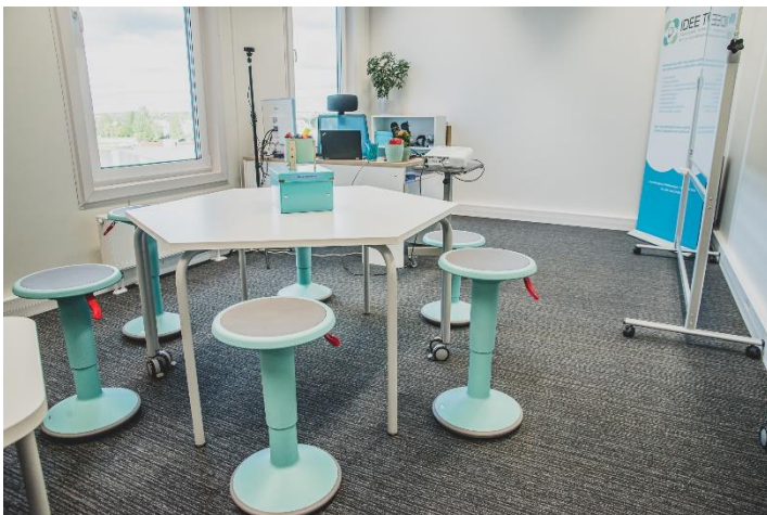
Joonis 6. Aktiivtoolid

Õppeklassides on moodullauad, mis võimaldavad moodustada laudadest erinevaid kombinatsioone. Ühes õppeklassis on ühekohalised laudad, teises kahekohalised - kombineerime neid laudu vastavalt õpperühmadele. Mõlema klassi moodullauad on ühe kõrgusega, et saaksime ka neid omavahel kombineerida. Õppijate toolid on ergonoomilised, õppijad saavad valida endale sobiva istumiskõrguse ja -laie, samuti saab reguleerida seljatuge. Rühmatööde puhul saavad õppijad kasutada ka aktiivtoole. Ergonoomilised aktiivtoolid UPis on 360-kraadilise liikumisvõimalusega, neid on võimalik lihtsa liigutusega sättida istuja järgi sobivasse kõrgusesse. Tänu toolijala kumerale põhjale hoiab see keha pidevalt aktiivseks töös ning parandab seeläbi energiaringlust ning aktiveerib väikeseid siselihaseid.