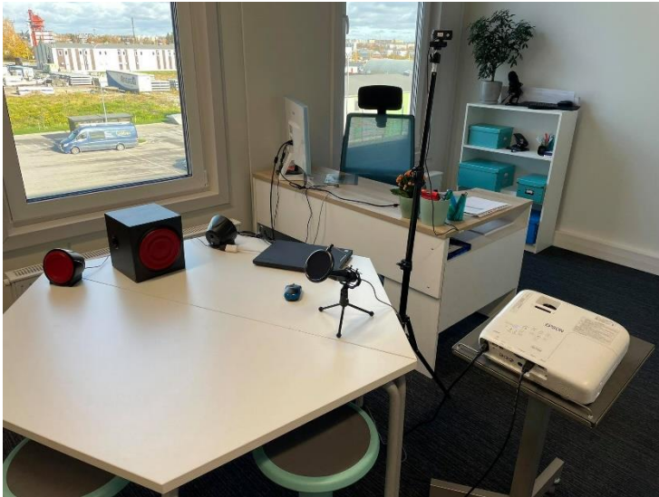
Joonis 8. Veebi- ja hübriidkoolitusteks vajaminev tehnika

Viimased kolm kuud oleme töötanud ainult Google Meet keskkonnas, kuid hetkel mõtleme ka riskide maandamisele. Kui üks keskkond ei tööta (mida oleme ka tunda saanud, kui Google oli terve päeva maas üle maailma), siis saaksime koheselt üle kolida teise keskkonda. Seetõttu ei ole me hetkel otseselt loobunud Zoom keskkonna kasutajakontost, lisaks tuleb arvestada sellega, et võib juhtuda olukordi, kus kõik õppijad näiteks eelistavadki Zoom keskkonda, siis saame vajadusel sinna üle kolida.