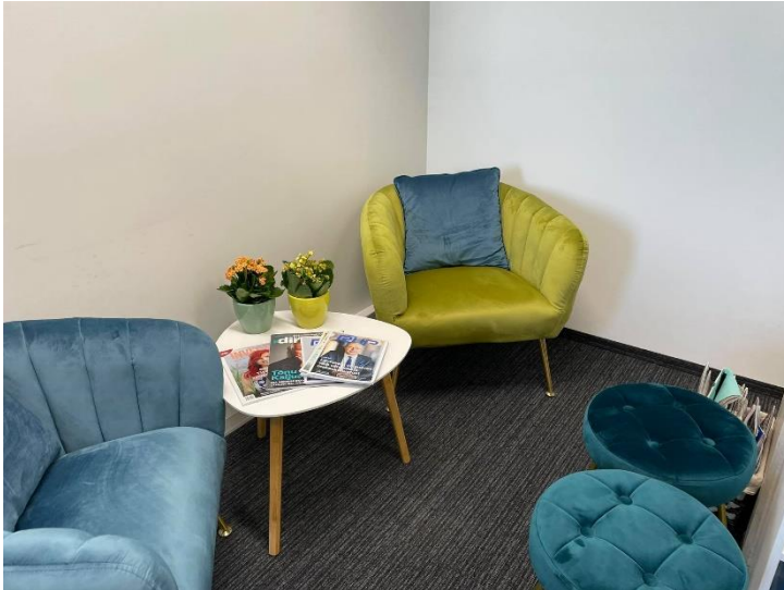
Joonis 7. Koolitusklassi I puhkenurk

Koolitusklassides on koolitaja kasutuses sülearvuti, lisamonitor, kõlarid, mikrofonid, data -projektorid, ergonomiline töötool, klaviatuur, hiir, ergonomiline hiirepadi, lisajuhtmed (USB jagajad, vahelülid jne). Koolitajate laud on varustatud A5, A4 (90 g ja 250 g), A3 paberitega. Ühtlasi on tagatud vajaminevad märkmepaberid ning markerid jne. Koolitaja saab kasutada pöörlevat tahvlit, seina külge kinnitatud tahvlit, jalgadel väiksemat pabertahvlit. Lisaks on koolitusklassides ka õppemängud (tunnete kaardid ja tegevuskaardid; sõnaseletusmängud rahatarkus ja vabadus, ajakasutus; motivatsioonikaardid, 100 pingelist olukorda tööelust ja selle lahendamise variandid; raha ja külgetõmbeseaduse kaardid; tujukaardid; kes ma olen?; CashFlow jne). Õppemänge saab kombineerida erinevate koolitustega, kuid üldjuhul on need olulised ettevõtluskursustel. Samuti on koolitajad loonud ise õppemänge (nt konkurentsiluure, raamatupidamise rollimängud). Õppeklassides on erinevate traditsiooniliste turunduskanalite näidised rühmatööde jaoks.