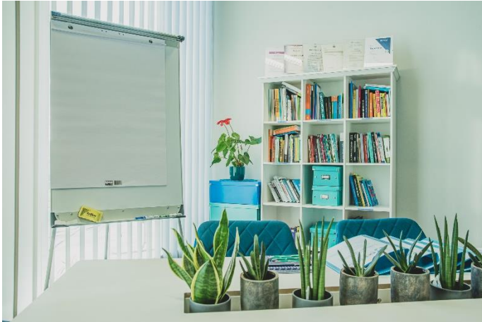
Joonis 2. Seminariruum ja miniraamatukogu