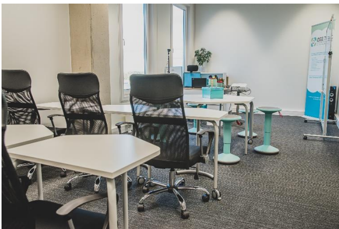
Joonis 4. Koolitusklass I

Koolitusklass I on peamine koolitusruum, kus on 12 õppekohta, kuid vajadusel mahutavad laudad ka rohkem õppijaid. Lisaks on võimalik võtta teisest koolitusklassist laudu ning toole juurde, kuid selleks, et koolitusel oleks mõistlik õppijate arv, me üldjuhul üle 12 õppija vastu ei võta. Koolitusklassis II on samuti 12 õppekohta, kuid üldjuhul on see ruum mõeldud rühmatööde läbiviimiseks, veebikoolituste korraldamiseks, väikeste rühmadega töötamiseks. Perioodil, mil oli lubatud õppijaid vastu võtta ka Covid kiirtesti tulemuse alusel, kasutasime väikest klassi ainult kiirtestimiseks.