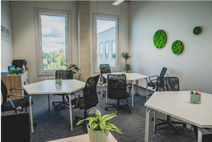
Joonis 5. Koolitusklass II

Õppeklassides on moodullauad, mis võimaldavad moodustada laudadest erinevaid kombinatsioone. Ühes õppeklassis on ühekohalised laudad, teises kahekohalised - kombineerime neid laudu vastavalt õpperühmadele. Mõlema klassi moodullauad on ühe kõrgusega, et saaksime ka neid omavahel kombineerida. Õppijate toolid on ergonoomilised, õppijad saavad valida endale sobiva istumiskõrguse ja -laie, samuti saab reguleerida seljatuge. Rühmatööde puhul saavad õppijad kasutada ka aktiivtoole. Ergonoomilised aktiivtoolid UPis on 360-kraadilise liikumisvõimalusega, neid on võimalik lihtsa liigutusega sättida istuja järgi sobivasse kõrgusesse. Tänu toolijala kumerale põhjale hoiab see keha pidevalt aktiivseks töös ning parandab seeläbi energiaringlust ning aktiveerib väikeseid siselihaseid.